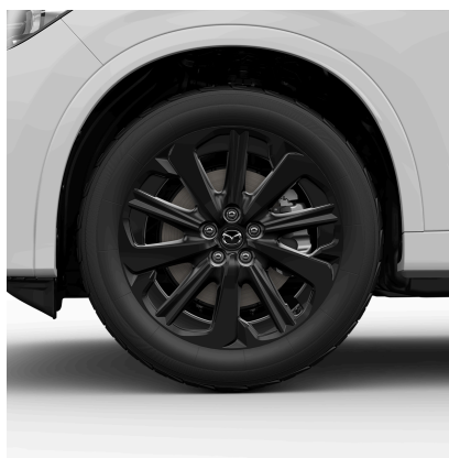
JANTE DIN ALIAJ DE 20 , NEGRE (235/ 50 R20)