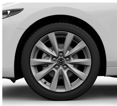
JANTE ALIAJ 18 CU PNEURI 215/45 R18